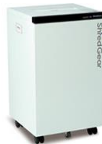
シュレッドギア kiwamiシリーズ