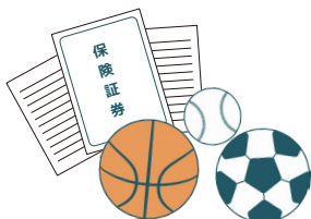
部活動で賠償責任保険に加入の場合は対象外です。