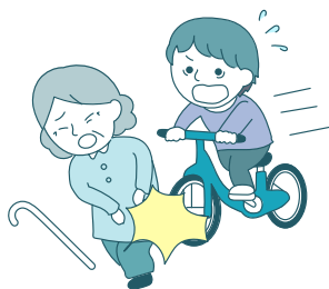
子供が自転車で人をはねた。