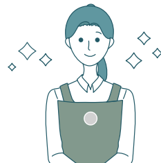
職務を遂行している場合は対象外です。