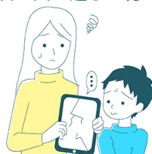
友達のゲーム機を壊してしまった。