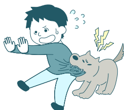
散歩中に犬が友達に噛みついた。