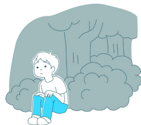
山遊びに行きはぐれてしまった。